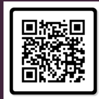
Les poneys de Lélou