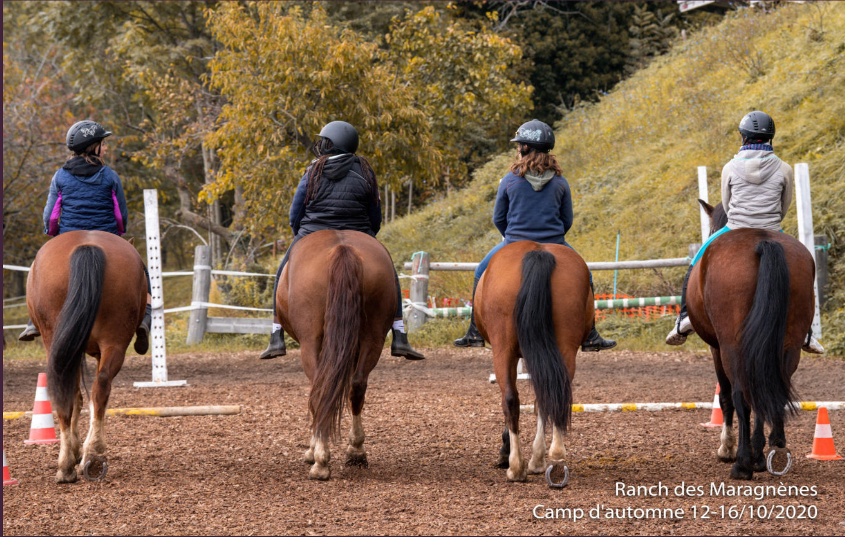
Ranch des Maragnènes Camp d'automne 12-16/10/2020